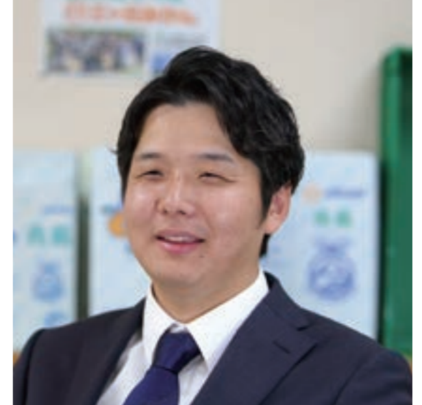
令和8年度農協青年連盟副委員長(西部支部)