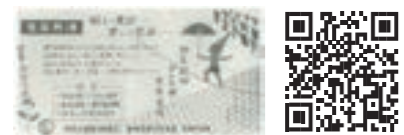
↑昭和30年当時の生命共済パンフレット。農青連組織をあげて推進に取り組んだ

紙面で紹介しきれなかったアーカイブの写真や、詳しい記事などはJAみっかび公式ホームページで毎月連載していきます。是非こちらもチェックしてみてください。