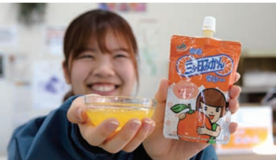
「ミカちゃん」をパッケージデザインにした「のむ三ヶ日みかんゼリー」。 直売所販売価格は243円(税込) 内容量120gの飲みきりサイズ