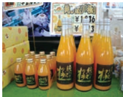
濃厚なストレートジュース「純しぼり『極』」 直売所販売価格 大瓶(720ml) 1,836円(税込) 小瓶(200ml) 513円(税込)

三ヶ日町農協特販課では「三ヶ日みかん」を使った新商品「のむ三ヶ日みかんゼリー」を開発し、3月20日から直売所や公式オンラインショップなどで販売しています。 同商品は三ヶ日みかん果汁を30%使用、着色料不使用のゼリーです。すっきりとした味でのど越しが良いのが特長です。キャップ付きのパウチ容器のため、外出先でも手軽に食べられます。