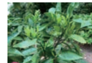
摘蕾処理2週間後の発芽の様子