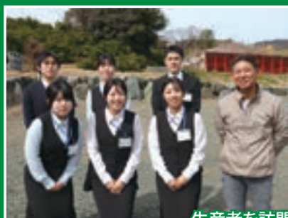
生産者を訪問し、現場で研修