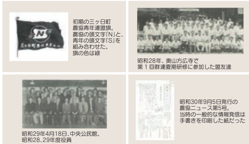
初期の三ヶ日町農協青年連盟旗。農協の頭文字「N」と、青年の頭文字「S」を組み合わせた。旗の色は緑

今年度の三ヶ日町農協アーカイブでは、農協と深い関わりのある組織を紹介していきます。まずは、「農協は我々のものだ」の旗印のもと、農協再建の推進役として雄々しく立ち上がった若者たち、三ヶ日町農協青年連盟(以下、農青連)の歴史を振り返ります。