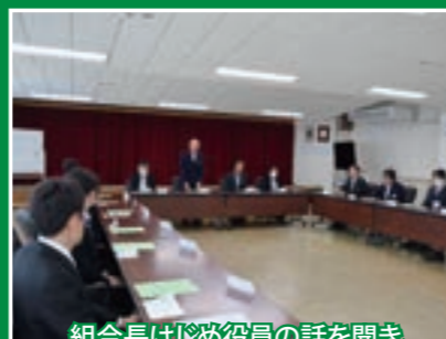
組合長はじめ役員の話聞き、各自の抱負を述べた閉講式