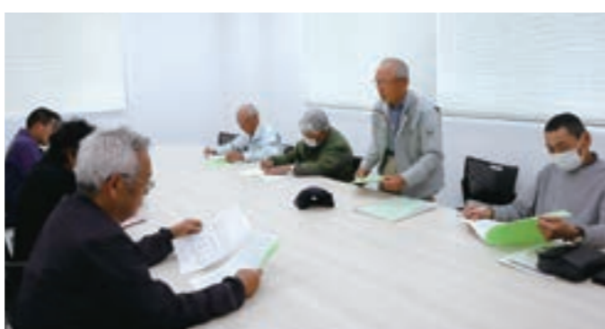
解散総会で挨拶する大谷会長(右から2人目)

昭和46年に設立した洋ラン部会規約は昭和48年確立ですが、高齢化による生産者の減少等により令和7年度末で解散しました。最盛期は34人の生産者がいましたが、令和7年度の部会員は6人になっていました。