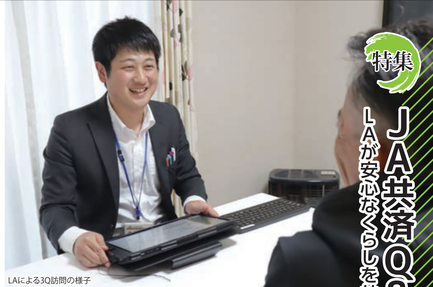
LAによる3Q訪問の様子

多くの皆さまが病気・災害・事故など、もしもの場合に備えて共済に加入しています。ただ、昔から何となく入っていた、詳しい保障内容を知らない、どんな保障が自分に合っているのか調べるのが面倒という方もよくいます。こうした相談に対応しているのが共済課の5人のLAです。この特集では身近なLAがどんな役割を果たしているのかをお伝えします。