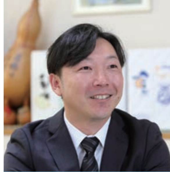
令和8年度農協青年連盟委員長(只木支部)