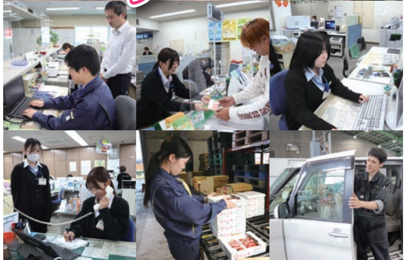
農協の園地で研修(上)、配属先の部署で仕事に励む6人の新入職員(中、下)